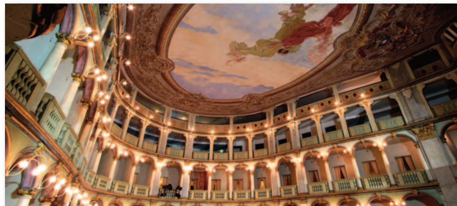
Teatro Fraschini, Pavia