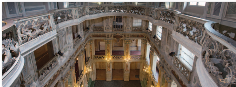
Teatro Grande, Brescia