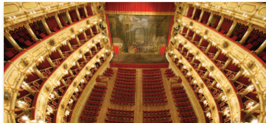
Teatro Ponchielli, Cremona