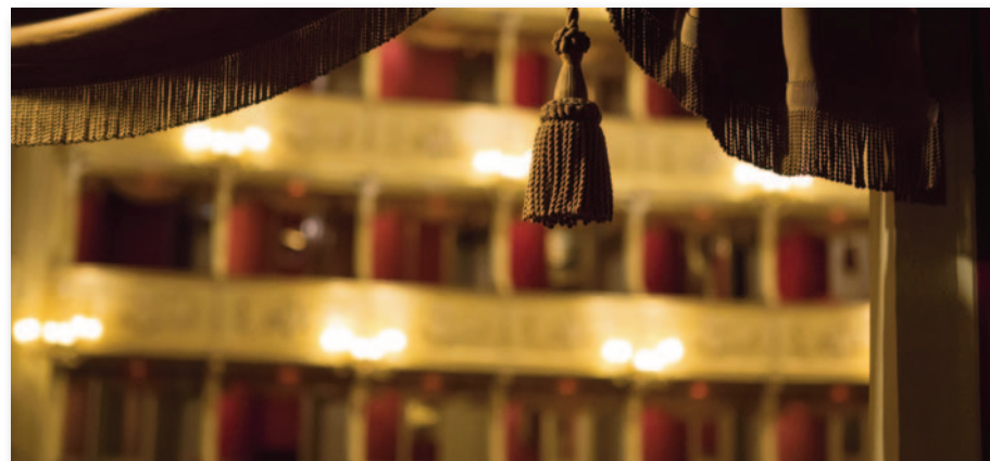
Teatro Sociale, Como