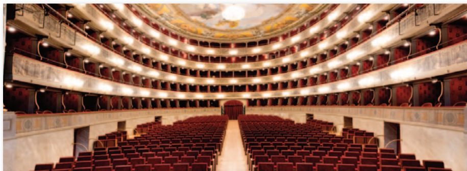
Teatro Donizetti, Bergamo

In programma: L'incoronazione di Poppea di Claudio Monteverdi, Madama Butterfly di Giacomo Puccini, Die Zauberflöte di Wolfgang Amadeus Mozart, Luisa Miller di Giuseppe Verdi, Don Carlo di Giuseppe Verdi.